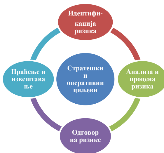
Слика 1. Процес управљања ризицима

Процес управљања ризицима састоји из четири основна корака која се примењују и на стратешке и на оперативне ризике: 1) идентификација ризика; 2) анализа и процена ризика; 3) одговор на ризике; и 4) праћење и извештавање.